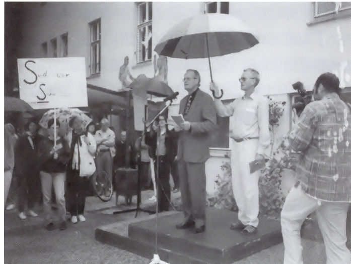
Eine der Pilgerstationen

Ein theologischer Leckerbissen war das prägnante und gut verständliche Referat von Jürgen Moltmann, der von seiner persönlichen theologischen Prägung durch Blumhardt ausging und dessen Bedeutung für die Zukunft unserer Welt ausführte: „Siehe da die Hütte Gottes“ in Bad Boll! Wer von denen, die einmal in Boll waren, wollte dem widersprechen? „Jesus bringt neues Leben - nicht eine neue Religion“ - dieser pietistische Ansatz weitet sich dann - nach Moltmann - in eine „Theologie der Erde“, die zur Grundlage hat, daß „Gott an mich glaubt“ (Blumhardt), und die in den „Christuszeichen“ etwa der Arbeiterbewegung und der Völkerbefreiung erfahrbar ist.